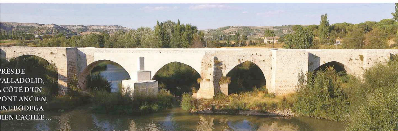
PRÈS DE ALLADOLID, CÔTÉ D'UN PONT ANCIEN, UNE BODEGA BIEN CACHÉE...